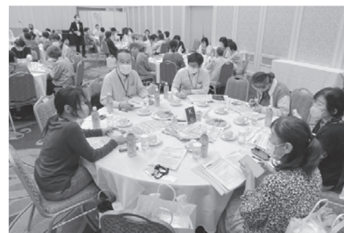
昨年の宮崎西ブロックの様子

ブロック総会では、総代会議案について理事より説明・提案があります。その後、グループ討議を通して、自由に意見を出し合えるようになっていきます。グループ討議には、職員も参加していますので、日頃聞けない生協のことなど、その場で回答を聴くこともできます。お気軽にご参加ください。