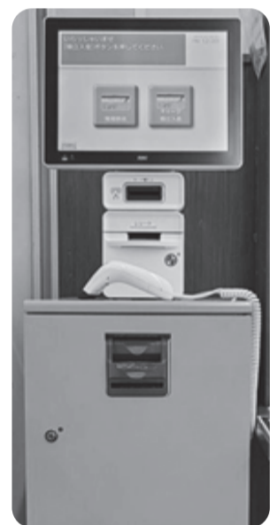
オレンジ色のボックス

レジでの支払いには、現金以外に『くらしの積立』の支払いもあります。ご本人のコープカードを使って、前もって『くらしの積立』にチャージ(入金)しておくことで、レジで現金を用意することなく、くらしの積立からお支払いができます。『くらしの積立チャージ機』をぜひご利用ください。