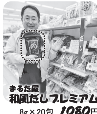
まるた屋 和風だしプレミアム 8g×20包 1080円 (税込1167円)