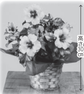
ロングライフハイビスカス 「プチオレンジ」 4,950円(税込)

毎年ハイビスカスを贈っていますが、すごく花が大きくて、豪華でキレイです。地に植えて庭には3種類(3年分)の花が咲いています。ひとつ咲くたびに「元気がもらえる」と義母から写真がLINEで送られてきます。