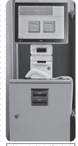
オレンジ色のボックス

レジでの支払いには、現金以外に『くらしの積立』の支払いもあります。ご本人のコープカードを使って、前もって『くらしの積立』にチャージ(入金)しておくことで、レジで現金を用意することなく、くらしの積立からお支払いができます。『くらしの積立チャージ機』をぜひご利用ください。