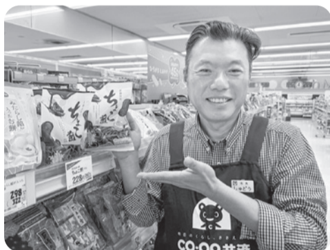
宮田製菓本舗 ちょこ煎90g 238円(税込258円)

私も早速、買って食べてみたところ、とても上品な味でおいしかったです。ゴールデンウィークで人が集まる機会も増えると思いますので、その際の一品にいかがでしょうか。きっと「おいしいわ♥」と感心いただける商品だと思います。ぜひ食べた感想もお待ちしています。