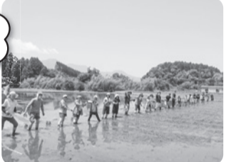
(写真は田植え風景です)

コープみやざきで取り扱っているお米 ひのひかりの産地小林市で、田植え交流会を開催します。昔ながらの植え方で苗を植えます。お米がどうやって育てられるのか学べる機会です。ご家族でご参加ください。