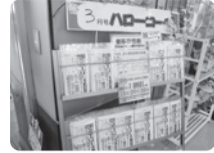
ハロー!コープ案内のラック

正面玄関近くでの催事の予定は、正面の掲示板にてご案内しております。また正面入り口のお持ち帰りできるハロー!コープのラックにも予定表を準備していますので、ぜひお持ち帰りいただき、当来店の参考にしてください！週に一回配信のCO-OP LINEでも店内情報と催事予定表も配信しています。ぜひ「お友だち登録」をして、お買い得な情報等もご確認ください。詳しくは、サービスカウンターでお問い合わせください。