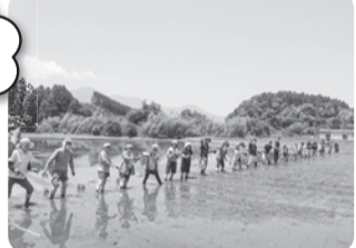
(写真は田植え風景です)

コープみやざきで取り扱っているお米 ひのひかりの産地小林市で、田植え交流会を開催します。昔ながらの植え方で苗を植えます。お米がどうやって育てられるのか学べる機会です。ご家族でご参加ください。