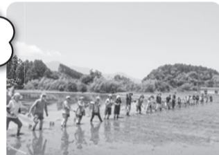
(写真は田植え風景です)

コープみやざきで取り扱っているお米 ひのひかりの産地小林市で、田植え交流会を開催します。昔ながらの植え方で苗を植えます。お米がどうやって育てられるのか学べる機会です。ご家族でご参加ください。