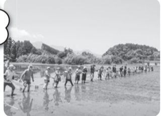
(写真は田植え風景です)

コープみやざきで取り扱っているお米 ひのひかりの産地小林市で、田植え交流会を開催します。昔ながらの植え方で苗を植えます。お米がどうやって育てられるのか学べる機会です。ご家族でご参加ください。