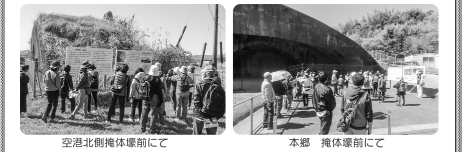
空港北側掩体壕前にて 本郷 掩体壕前にて