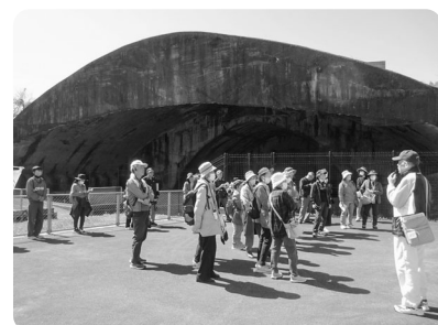
有蓋掩体壕を見学。県内では最大規模