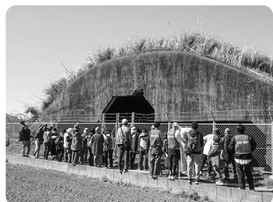
宮崎空港北側にある有蓋掩体壕を見学