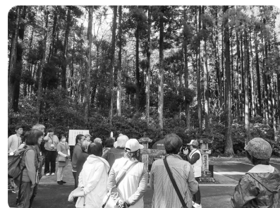
特攻兵が宿泊した三角兵舎跡