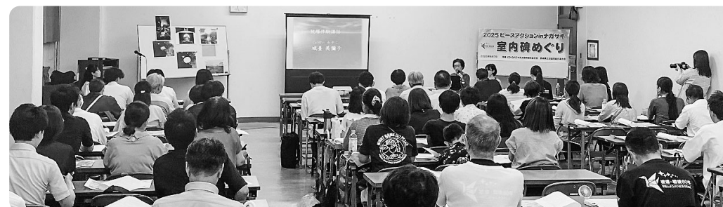
被爆の証言を聴きました