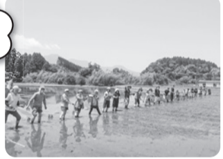
(写真は田植え風景です)

コープみやざきで取り扱っているお米 ひのひかりの産地小林市で、田植え交流会を開催します。昔ながらの植え方で苗を植えます。お米がどうやって育てられるのか学べる機会です。ご家族でご参加ください。