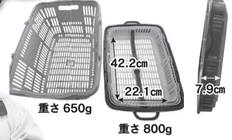
左:ピンクのマイバスケット 右:ニューバスケット ※大きさはほぼ同じです。