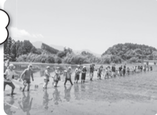
(写真は田植え風景です)

コープみやざきで取り扱っているお米 ひのひかりの産地小林市で、田植え交流会を開催します。昔ながらの植え方で苗を植えます。お米がどうやって育てられるのか学べる機会です。ご家族でご参加ください。