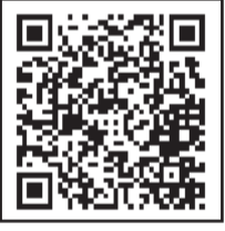
小林店 二次元コード

お店や生活サービスセンターからの旬な情報、店長のつぶやきなどを配信しています。店休日のお知らせやハロー!コープの紙面も配信しています。複数店舗の登録も可能です。詳しくはサービスカウンターへ、お気軽にお声がけください。登録をお待ちしています。