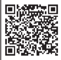
宮脇店 二次元コード

お店や生活サービスセンターからの旬な情報、店長のつぶやきなどを配信しています。店休日のお知らせやハロー！コープの紙面も配信しています。複数店舗の登録も可能です。詳しくはサービスカウンターへ、お気軽にお声がけください。登録をお待ちしています。