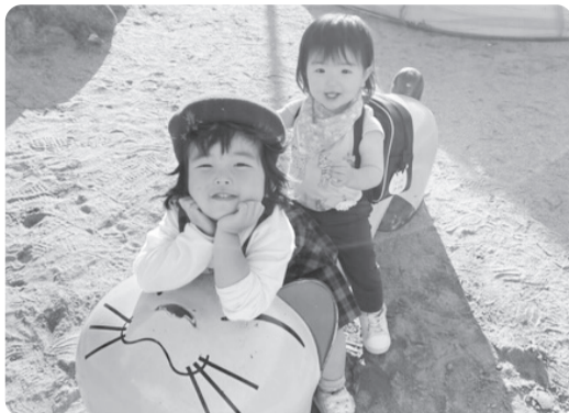
左: ちあきちゃん(3歳4カ月) 右: あまねちゃん(1歳4カ月)