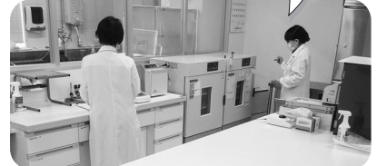
商品検査をしているようす

食品腐敗と食中毒の原因となる微生物が基準内におさまっているかどうかの検査を行っています。