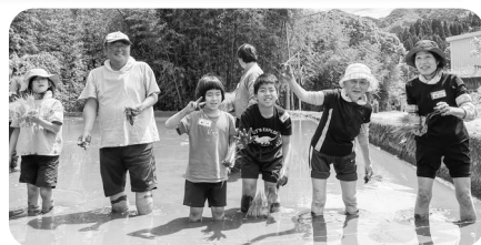
たくさんのお子も参加してくれました

先日30年ぶりに高千穂に行きました。朝6時に宮崎市内の自宅を出発し、高速道路を利用して2時間ちよつと。8時過ぎには高千穂に着です。普段まったりと生活している私は、久しぶりの遠出、それも早朝出発ということで、前の晩はなかなか寝付けず、夜中に何度も目覚めて時計を確認しました。 途中、日向では朝陽を照り返す美しい海を横目に見ながら、延岡から九州中央道へ。景色は新緑がまぶしい山の景色にかわっていき、日之影を抜けるとあつという間でした。 予定より少し早く着いたので、高千穂神社に行ってみました。立派な木々に囲まれてたたく静謐な神域やご神木を見上げてみると、太古からの静かなエネルギーが感じられ、神様がいらっしゃるかもしれないと思ひました。 その後、いくつか神社めぐりしましたが、その所々でそれぞれ趣があつて、楽しめました。あちこちで見かけた切り絵もすてきで、御朱印を求める方も多かったです。 今や国内外から多くの人を訪れる神話の里、高千穂。この地にまつわる神話も読んでみたくなりました。今度は泊まりがけでゆつくりと行きたいです。