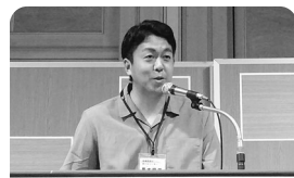
例発表会 仕事の工夫や改善をしました発表会 部門・事業所に徹底的に学びます！ 生活協同組合 コープ

職員が、仕事の中で工夫していることや、みんなの知恵を合わせて改善を重ねている事例を、発表する機会を設けました。日頃の努力を組合員さんにも聴いていただきたいと思ひます。